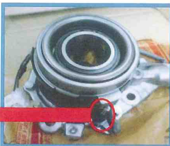
■ パワーシリンダーASSY