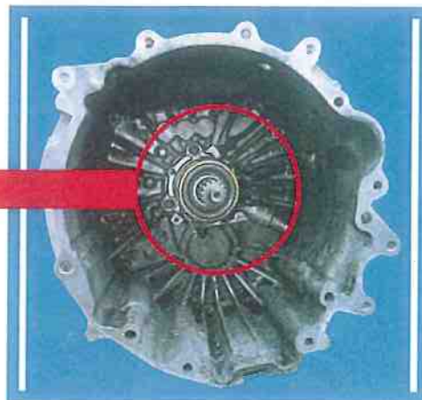
■ トランスミッションハウジング