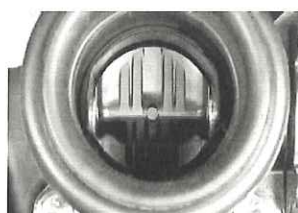
スロットルバルブ(閉)